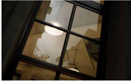
整修後實景，一樓大廳局部 ／戶外窗影

打通「重啟」思維與執行的各個環節，有效率地向各界深入解明休館三年的整修工程，以及導引一個可以共同攜手創造的新局。